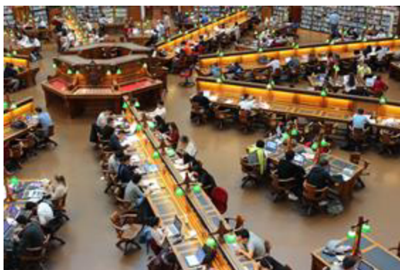
Imagen 1. Biblioteca Photo De ángulo Alto (CCO)

Reconocer las diferentes plataformas tecnológicas del SENA, que le permita conocer los beneficios y las bondades que estas brindan dentro de su proceso formativo.